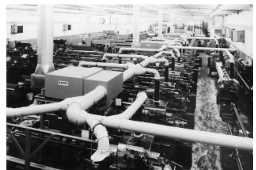
Absaugsystem. Es besteht die Möglichkeit, die abgesaugte und filtrierte Luft in den Raum zurückzuführen oder ins Freie abzuleiten.