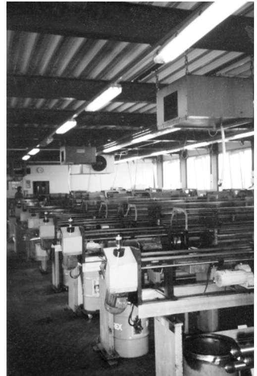
Décolletage-Werkstatt mit künstlicher Raumlüftung. Die Luft wird nach der Filtration wieder in den Arbeitsplatzbereich zurückgeführt.