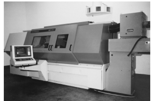
Eingekapselte Maschine mit Absaugvorrichtung und elektrostatischem Filter.